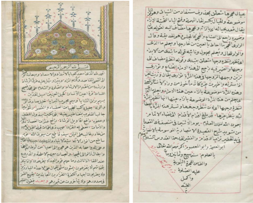
Ek 1: İstanbul Üniversitesi Nadir Eserler Kütüphanesi nekty03385 nüshasının ilk ve son sayfaları.