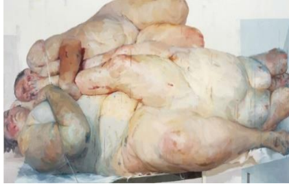
Görsel 2: Jenny Saville, Dayanak Noktası, 1999.

Britanyalı sanatçı Jenny Saville (1970) ise kadın bedeninin yıllarca esaret içinde olduğu kusursuz beden temsiline bir başkaldırı sunmaktadır. Saville çalışmalarındaki kadınları iri ve itici oldukları düşündürülen kadınlar olarak tanımlamaktadır (Barrett, 2022, s. 104). Saville'nin bir et yığını gibi resmettiği kadınlar, aslında kadının bedeniyle girdiği savaşı yansıtmaktadır. "Dayanak noktası" adlı eserinde üst üste istif edilmiş üç kadın bedeni görülmektedir. Bedenleri içinde sıkışmışlık hissi yaşayan kadın temsili medyanın ve tüketim toplumunun kadın üzerindeki baskısının temsildir (Görsel 2).