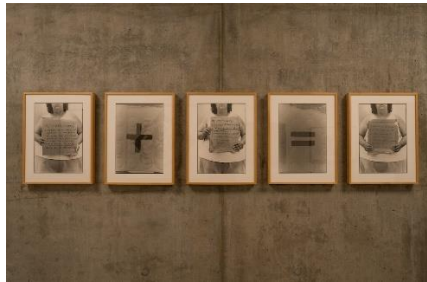
Görsel 6: Laura Aguilar, Access + Opportunity = Success, 1993.

Otoportreleriyle tanınan Meksika kökenli Amerikalı fotoğraf sanatçısı Laura Aguilar (1959-2018) ise, marjinal toplulukları öne çıkarmaya çalıştığı fotoğraflarında, çoğu kez kendini ve bu topluluktan insanları kullanmıştır. Queer, obez, melez, işçi sınıfı, engelli ve lezbiyen kimliklere yer verdiği fotoğraflarında, kimliğin sınırlı alanlarının sorgulanmasına bir aralık açarak bireyin kendi gözünden ve başkalarının gözünden görünmesi ikilemini yansıtmaktadır. Laura Aguilar, "Access + Opportunity = Success (1993)" adlı çalışmasında elinde tuttuğu bir karton üzerine yazılmış "Erişim + Fırsat = Başarı" yazan bir denklem yer almaktadır (Görsel 6). Ayrıca denklemde bulunan her bir kelimenin sözlük anlamları da yazılmıştır. Fotoğrafta sanatçının portresi yarıdan kesilmektedir. Bu kompozisyon biçimi sanat kurumlarının kendi gibi lezbiyen, engelli, Latin kökenli sanatçıların tanınmalarındaki engeli işaret etmektedir ("Laura Aguilar", 2024). Sanatçı dezavantajlı görünen toplulukların hayatta yer alma çabasının zorluğunu formüleştirerek göstermiştir. Ayrıca genel söylemlere karşı bir duruş içermektedir.