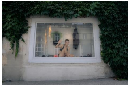
Görsel 5: Lyn Bentschik, Schaufenster (Vitrin), Video Performans 1: 09 dakika 2022.

Kimlik ve kimlik rolleri hakkında kurguladığı performanslarıyla tanınan bir diğer sanatçı İsviçreli Performans sanatçısı Lyn Bentschik'tir. Sanatçı kimlik ve kimliğin akışkanlığını kıyafetler üzerinden araçsallaştırarak kurgulamaktadır. "Schaufenster (Vitrin)" adlı performansında kamuya açık bir alanda yer alan dar bir vitrin içerisinde kendine ait bazı kıyafetleri giymektedir (Görsel 5). Sanatçı performansı boyunca değiştirdiği kostümleri arasında dans kostümü, ev içi kullanılan önlük, bisiklet kullanırken giydiği kıyafetler bulunmaktadır. Bu giysileri tekrar tekrar soyunup giyinerek kimliğin akışkanlığını sorgulamaktadır ("Schaufenster Video Performance", 2024).