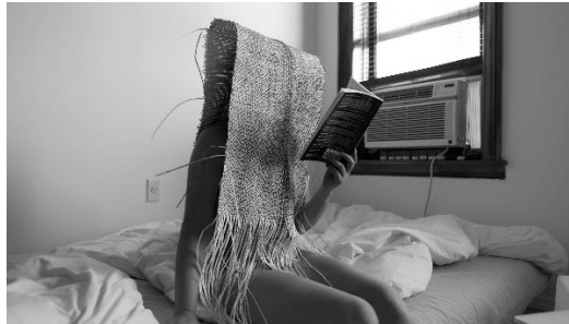
Görsel 9: Bang Geul Han, Warp and Weft #02 - Reading, 2022.

Bu yasalara dikkat çekmeyi hedefleyen sanatçı, insanları bağlayan yazılı yasaları görsel bir nesneye çevirerek izleyiciyi var olan gerçeğe tanık etmektedir.