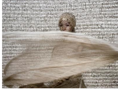
Görsel 1: Lalla Essaydi, Yakınsak Alanlar, 2003.

Britanyalı sanatçı Jenny Saville (1970) ise kadın bedeninin yıllarca esaret içinde olduğu kusursuz beden temsiline bir başkaldırı sunmaktadır. Saville çalışmalarındaki kadınları iri ve itici oldukları düşündürülen kadınlar olarak tanımlamaktadır (Barrett, 2022, s. 104). Saville'nin bir et yığını gibi resmettiği kadınlar, aslında kadının bedeniyle girdiği savaşı yansıtmaktadır. "Dayanak noktası" adlı eserinde üst üste istif edilmiş üç kadın bedeni görülmektedir. Bedenleri içinde sıkışmışlık hissi yaşayan kadın temsili medyanın ve tüketim toplumunun kadın üzerindeki baskısının temsildir (Görsel 2).