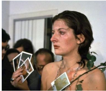
Görsel 3: Marina Abramovic, Rhythm 0, 1974.

Sırp performans sanatçısı Marina Abramovic (1946) ise şiddeti temsil eden birçok performans gerçekleştirmiştir. Sanatçı çoğu kez bedenini izleyiciye emanet ederek savunmasız şekilde şiddeti deneyimlemiştir. Abramovic'in gerçekleştirdiği "Rhythm 0" performansında, izleyicilerin kullanması için bir masa üzerinde yer alan 72 obje bulunmaktadır (Görsel 3). Bu objeler gül, parfüm, çiçek, kalem ve gazete gibi zararsız objelerden oluşmasının yanı sıra çekiç, makas, bıçak gibi zarar verici objeleri de içermektedir. Bu nesnelerin performans boyunca sanatçının bedeni üzerinde izleyiciler tarafından kullanılmasına müsaade edilmiştir. Abramovic bedenini bir nesne olarak görünmesini istemiştir. Performansın başlarında sakinlik hakimken ilerleyen süreçte insanların sanatçının bedenine olan müdahaleleri şiddet boyutuna taşınmıştır (Yorulmaz, 2024, s. 225). Abramovic bedenini burada nesne temsili dönüşürerek şiddet ile ilişkisini yansıtmıştır.