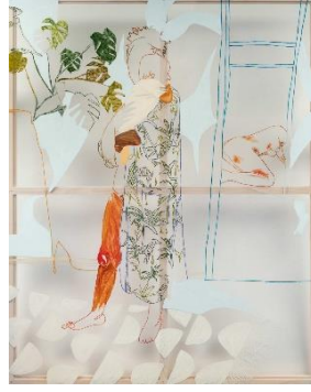
Görsel 4: Miranda Forrester, Arrival, 2023.

Kimlik ve kimlik rolleri hakkında kurguladığı performanslarıyla tanınan bir diğer sanatçı İsviçreli Performans sanatçısı Lyn Bentschik'tir. Sanatçı kimlik ve kimliğin akışkanlığını kıyafetler üzerinden araçsallaştırarak kurgulamaktadır. "Schaufenster (Vitrin)" adlı performansında kamuya açık bir alanda yer alan dar bir vitrin içerisinde kendine ait bazı kıyafetleri giymektedir (Görsel 5). Sanatçı performansı boyunca değiştirdiği kostümleri arasında dans kostümü, ev içi kullanılan önlük, bisiklet kullanırken giydiği kıyafetler bulunmaktadır. Bu giysileri tekrar tekrar soyunup giyinerek kimliğin akışkanlığını sorgulamaktadır ("Schaufenster Video Performance", 2024).