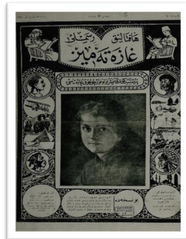
Resim 1. Haftalık Resimli Gazetemiz 'in 1. Sayısı Resim 2. Mektepliler Alemi 'nin 1. Sayısı